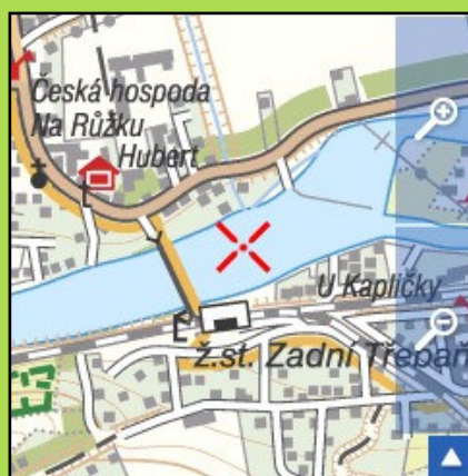
Turistická mapa obce